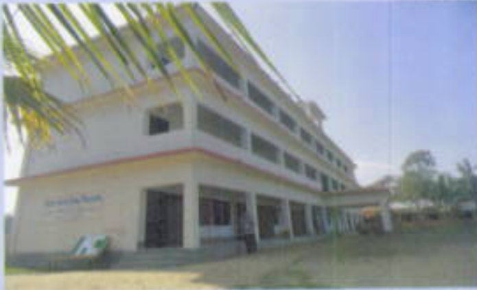
দীঘিনালা উদালবাগান হাই স্কুল নির্মাণ।