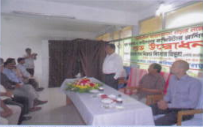
জেলা পরিষদ কম্পিউটার ল্যাব উদ্বোধন।