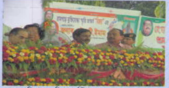
রামগড় মুক্তিযোদ্ধা স্মৃতি সড়কার্য উদ্বোধন