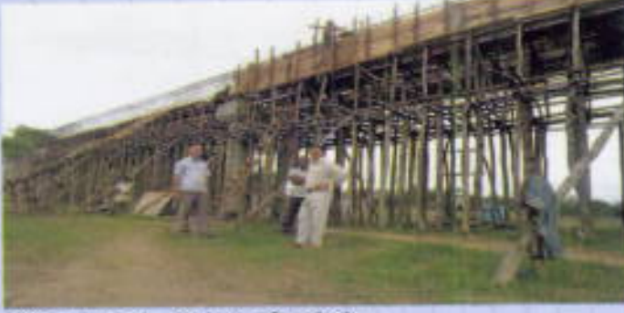
দীঘিনালা মাইনী নদীর উপর ব্রীজ নির্মাণ।

খাগড়াছড়ি পার্বত্য জেলা পরিষদ কর্তৃক বাস্তবায়িত কয়েকটি উন্নয়ন প্রকল্প :