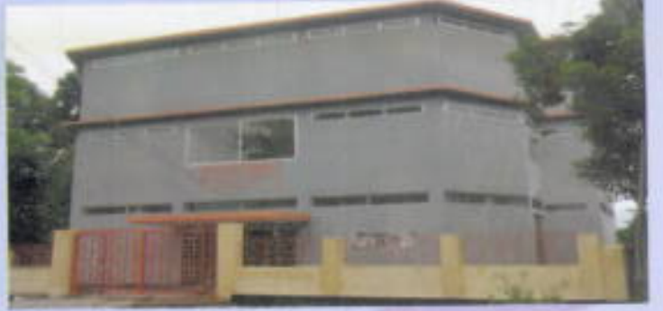
খাগড়াছড়ি মিউজিয়াম নির্মাণ।