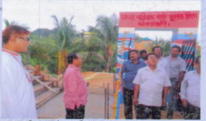
জেলা পরিষদ পার্ক খুলন্ত ব্রীজ উদ্বোধন