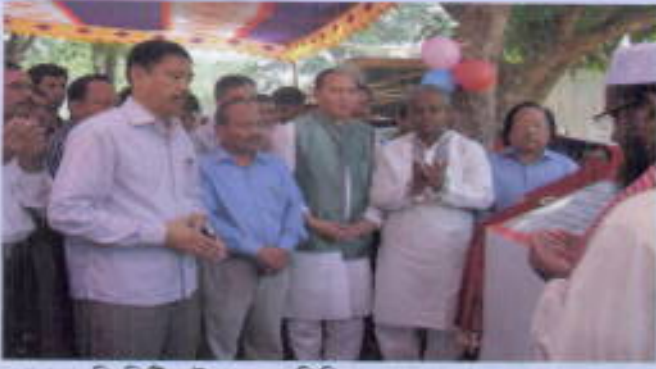
খাগড়াছড়ি পিটিআই ভবনের ভিত্তিপত্রের স্থাপন