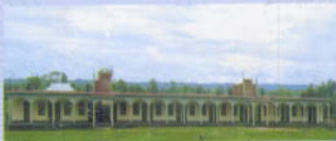
খাগড়াছড়ি সদর উপজেলার ঠাকুরছড়া হাইস্কুল নির্মাণ।