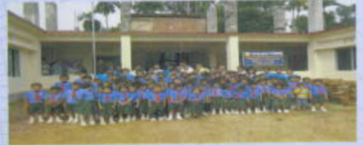
খাগড়াছড়ি সানস্কাওয়ার ইনস্টিটিউট নির্মাণ।