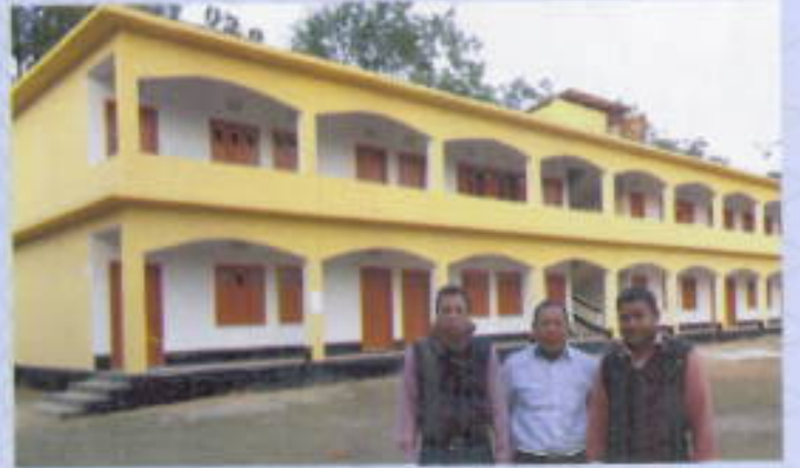
মাটিররাংগা শান্তিপুর হাইস্কুল নির্মাণ।